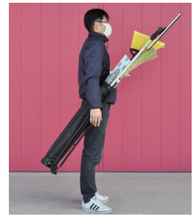
肩にかけたイメージ