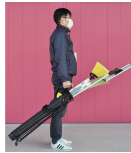
手で持つイメージ